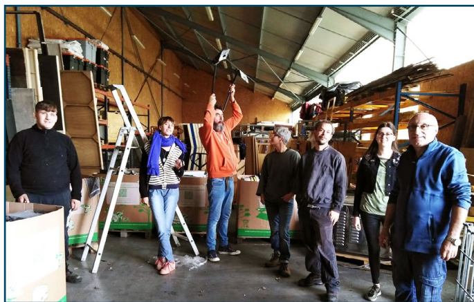
L'équipe de La Ressourcerie Culturelle

Début 2020, avant les premières annonces gouvernementales sur les restrictions sanitaires, la Ressourcerie culturelle est toujours incubée au Moulin Créatif et débute sa phase de développement. Elle vient tout juste de prendre un local de 1 000 m 2 en location afin de collecter davantage.